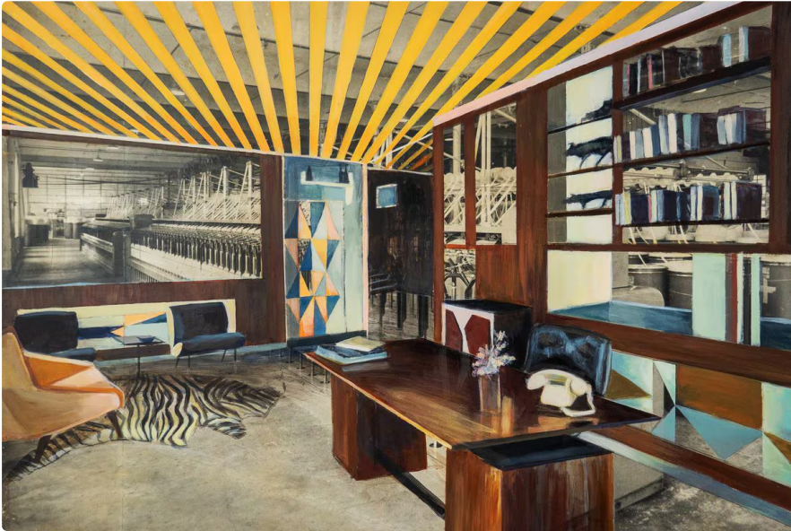
Bea Sarrias, The bureau, Gio Ponti, Villa Planchart, acrylique sur vieille image sur bois, 70 x 99 cm. @L'artiste et Michèle Schoonjans Gallery