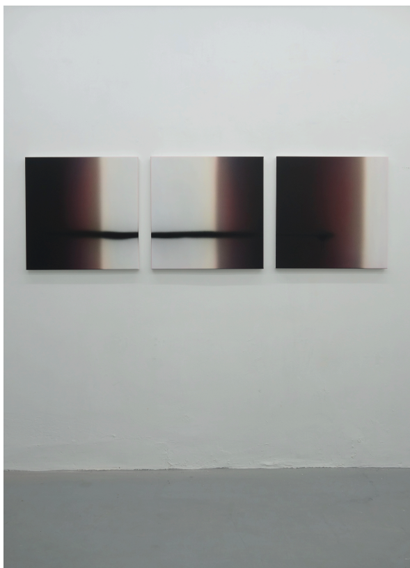
"James fragmentation 4", acrylique sur toile, 60 x 60 cm (x3), 2020

contact : info@micheleschoonjansgallery.be | +32 478 716 296